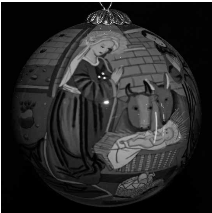
Collectie Heiligenbeeldenmuseum Kranenburg