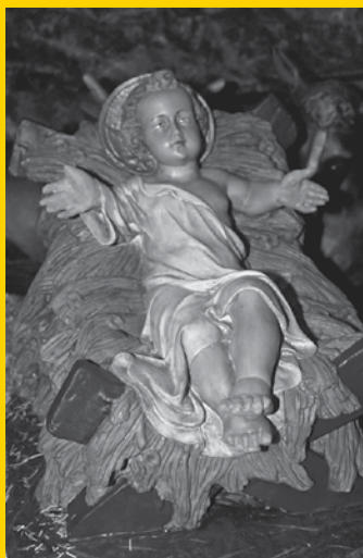
Foto voorzijde: Kerstkind uit collectie Heiligenbeeldenmuseum Kranenburg (bij Vorden)