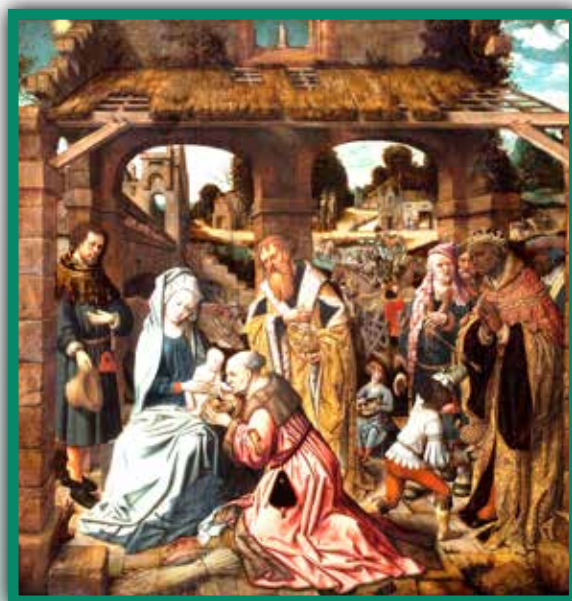
^ Driekoningen, onbekende meester. Noord-Nederland, omstreeks 1520.

Door de eeuwen heen hebben veel kunstenaars een voorliefde voor de aanbidding door de drie koningen. Ze kunnen er al hun creativiteit in kwijt. In de voorstelling, de kleuren en de symboliek. Vaak zijn de koningen van verschillende leeftijd en een van hen, Balthasar, heeft een zwarte huidskleur. Zo kunnen ze de afstammelingen zijn