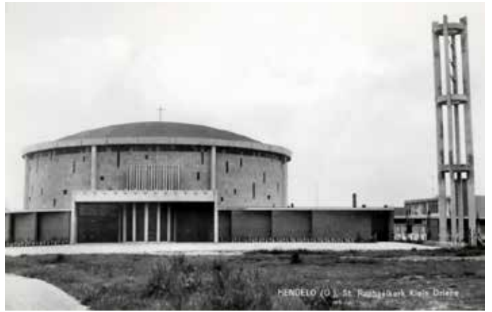
^ Raphaëlkerk, omstreeks 1960.