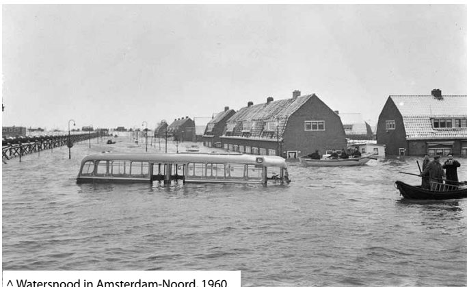
^ Watersnood in Amsterdam-Noord, 1960.

Langzaam wordt Klein Driene volgebouwd. Er komen scholen en vanuit de Valeriusstraat zien ze de Raphaëlkerk bouwen. Het weidse uitzicht verdwijnt. Als er in januari 1960 een dijkdoorbraak is in Amsterdam-Noord en het water daar 1,5 m hoog in de straten en de huizen staat, komen haar ouders een poosje in Klein Driene logeren. Dan blijkt het huis toch niet zo groot te zijn als ze dachten.