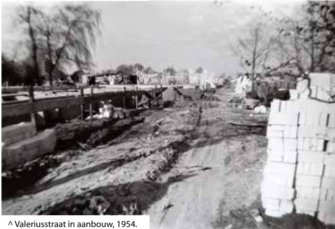
^ Valeriusstraat in aanbouw, 1954.