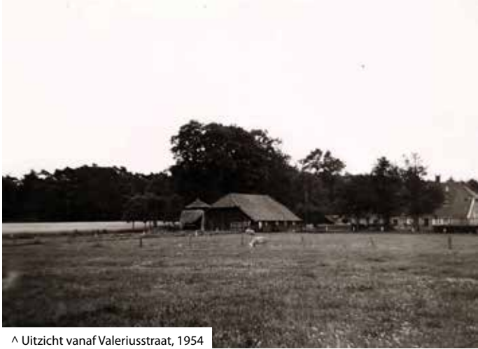
^ Uitzicht vanaf Valeriusstraat, 1954